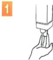
1 doza de sapun