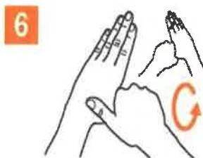
6 Degetul mare