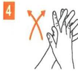
4 intre degete Stanga si invers