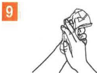
9 Uscare prosop hartie