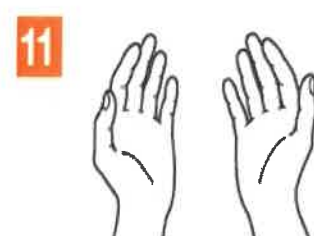
11 MAINI SIGURE