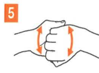
5 degete intrepatruse