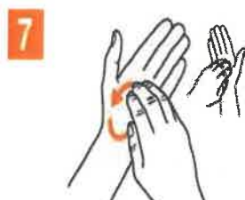
7 degetele in palma