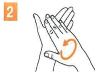
2 palma peste palma