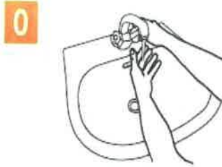
0 Umectare maini