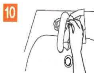
10 inchidere robinet cu prosopul de hartie